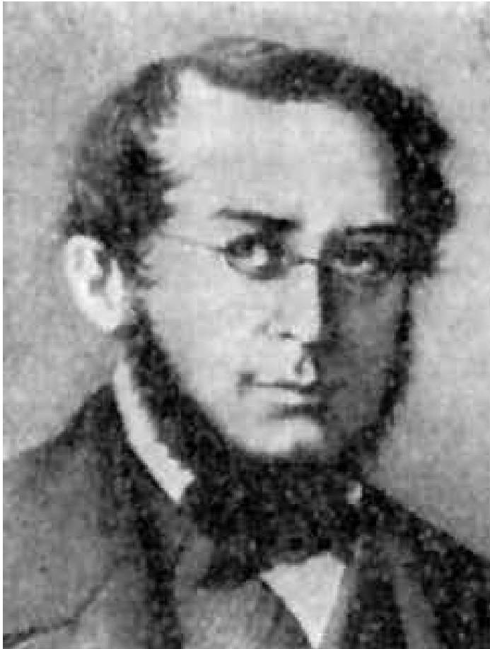
Пьер Жозеф Прудон