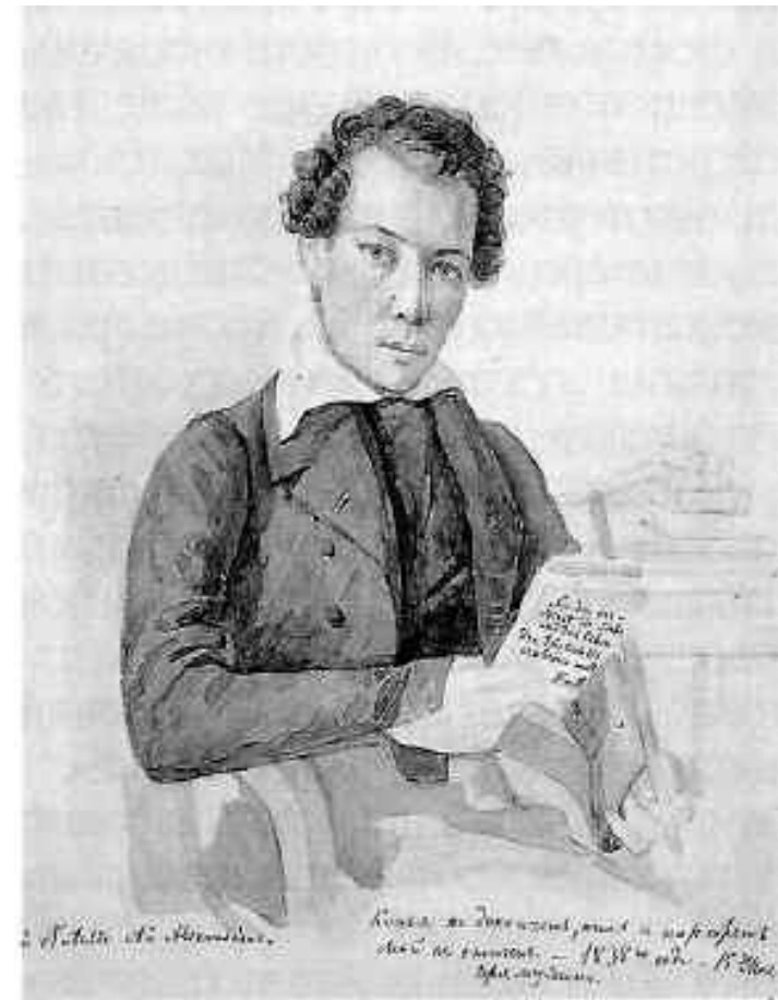
М.Бакунин. Автопортрет. 1838 г.

Кропоткин находил в окружающем мире ростки коммунизма и анархии — множество союзов и ассоциаций, основанных (хотя бы отчасти) на негосударственных и небуржуазных принципах. Это научные общества, библиотеки, кооперативные и муниципальные учреждения, страховые союзы, артели, коммунальные службы, благодаря которым «за известную плату, по столько-то в год, вы имеете право удовлетворять такой-то разряд ваших потребностей — за исключением, понятно, роскоши в этих потребностях».