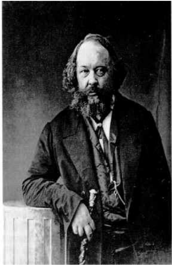
М.А.Бакунин. Фотография 1860-х гг.

исторический оптимизм, предполагающий акцент на созидание, а не на разрушение). Поэтому-то так важно еще до начала революции распространить новые идеи, сформировать революционное сознание и революционного субъекта , которым, по Кропоткину, не может быть какая-то одна партия или класс, но лишь весь трудовой народ в целом.