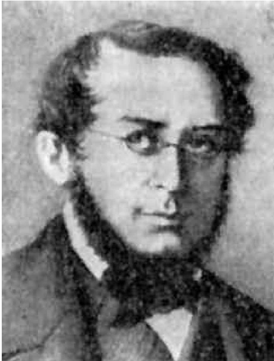
Пьер Жозеф Прудон