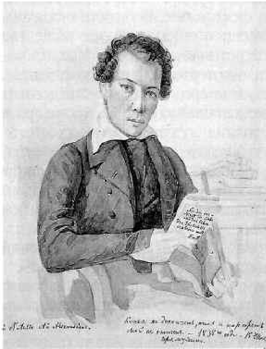
М.Бакунин. Автопортрет. 1838 г.