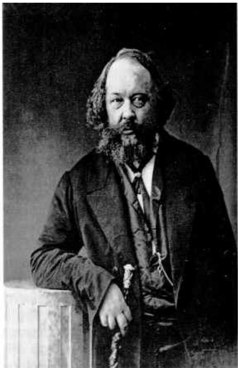
М.А.Бакунин. Фотография 1860-х гг.